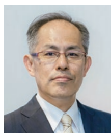
島根大学医学部長