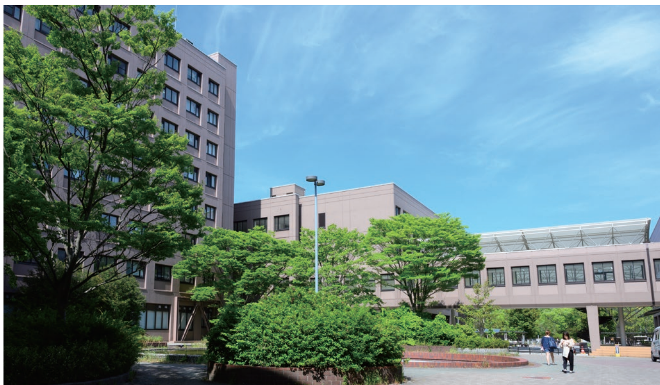
Shimane University School of Medicine 50th Anniversary